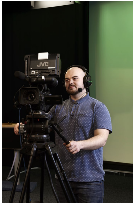
Abbildung 10: Willkommensmappe des Fachbereichs Technik

Die drei Motive spiegeln die drei Abteilungen des Fachbereichs wider: die Abteilung Maschinenbau (Abb. 8), die Abteilung Naturwissenschaftliche Technik (Abb. 9) und die Abteilung Elektrotechnik und Informatik (Abb. 10). Sie werden nun angereichert durch die Bilder der einzelnen Studiengänge. Die Motive wiederholen sich in wandelnder Gestalt. Es geht auf den Bildern entweder um Lehr-Lern-Situationen oder um praktische Tätigkeiten in Labor bzw. Werkstatt oder um das Handling von technischen Geräten in einem Anwendungskontext. Auffällig ist, dass Geschlechterstereotype in den Szenarien vermieden wurden, also beispielsweise Frauen sich nichts von Männern erklären lassen müssen, sondern als aktiv Handelnde dargestellt werden. Frauen sind auch häufiger abgebildet als es ihre Unterrepräsentanz im Fachbereich nahelegen würde. Die Bildauswahl lässt insgesamt vermuten, dass für das Thema „Frauen in MINT-Studiengängen“ eine gute Sensibilität besteht.