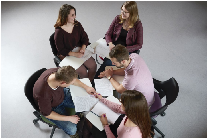
Abbildung 3: Willkommensmappe des Fachbereichs Soziale Arbeit und Gesundheit

darin auch die spätere Realität des Berufsfeldes spiegeln, mit der die Absolvent*innen zu tun haben werden. Unterstrichen wird die Bedeutung von Interaktion und Kommunikation für den Fachbereich darin, dass am Flipchart ein Kommunikationsmodell erläutert wird. Thematisch sind die drei Bereiche Wissensvermittlung, Reflexion in der Gruppe und praktisches Tun im Spiel abgebildet. Alle drei stehen gleichberechtigt nebeneinander, womit der Fachbereich auf das Kompetenzmodell aus Wissen, Wollen und Handeln anspielen könnte, dem sich die Hochschule verpflichtet fühlt. Geschlecht wird zunächst durch die abgebildeten Personen dargestellt, die das Ungleichgewicht von männlichen und weiblichen Studierenden im Fachbereich repräsentieren. Interessant ist allerdings, dass die Rolle des Wissensvermittlers in der Frontalsituation vor dem Flipchart dem Mann zugeschrieben wird, während in den anderen Situationen alle Personen gleichberechtigt an der Szene beteiligt sind.