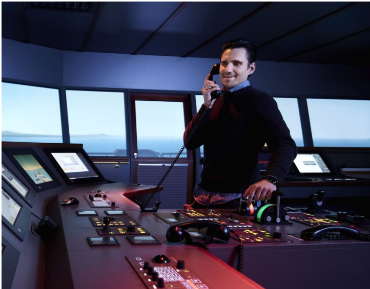
Abbildung 5: Willkommensmappe des Fachbereichs Seefahrt und Maritime Wissenschaften

Im ersten Bild lächelt uns ein Mann entgegen, der am Führungsstand eines großen Schiffes (Simulator) steht, mit einer Hand einen Telefonhörer hält und mit der anderen einen Schalthebel bedient.