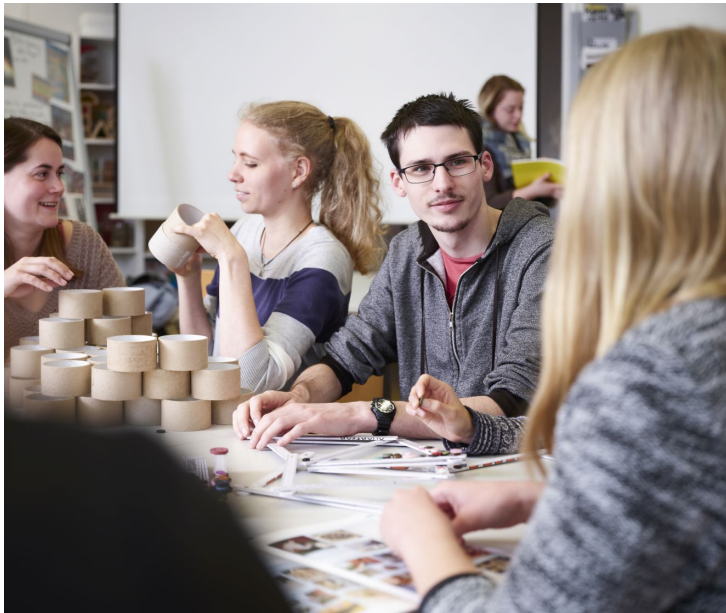
Abbildung 1: Willkommensmappe des Fachbereichs Soziale Arbeit und Gesundheit

Das erste Bild zeigt eine Spielsituation. Drei Frauen und ein Mann sitzen an einem Tisch, dabei sind jeweils zwei Personen aufeinander bezogen und spielen offenbar etwas mit unterschiedlichen Materialien. Im Hintergrund ist eine Studentin zu sehen, die ein Buch in der Hand hält und wahrscheinlich, aber nicht sichtbar, in ein Gespräch mit einer weiteren Person vertieft ist.