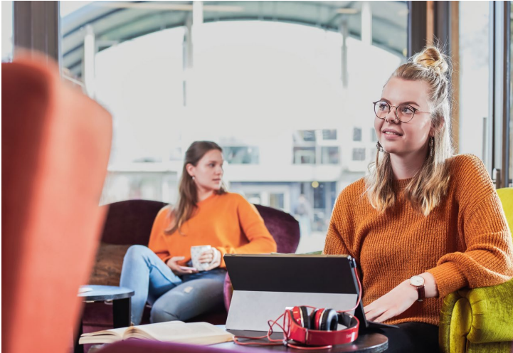
Abbildung 4: Willkommensmappe des Fachbereichs Soziale Arbeit und Gesundheit, Flyer Sozial- und Gesundheitsmanagement

becher in der Hand und schaut aus dem Fenster. Die Person im Vordergrund hat ihren Laptop vor sich aufgeklappt, an dem Kopfhörer angeschlossen sind. Ein Buch liegt aufgeschlagen daneben. Der Blick ist auf einen unbestimmten Punkt im Raum gerichtet.