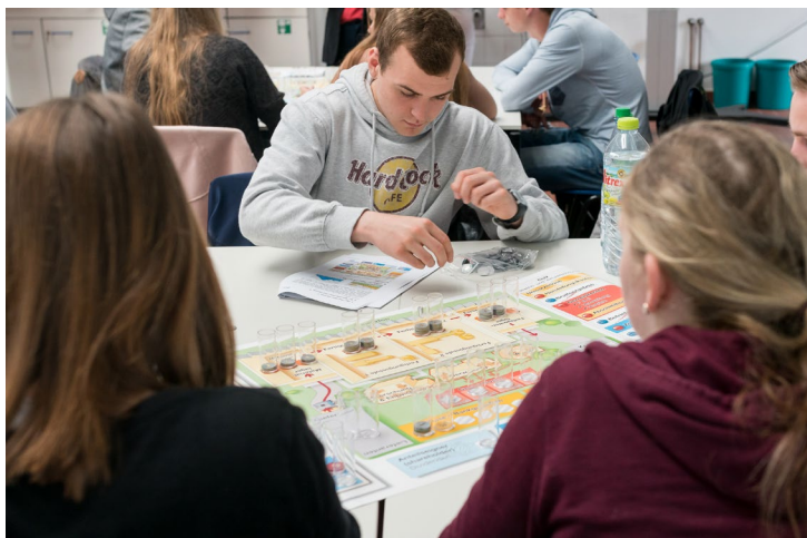
Abbildung 12: Willkommensmappe des Fachbereichs Wirtschaft