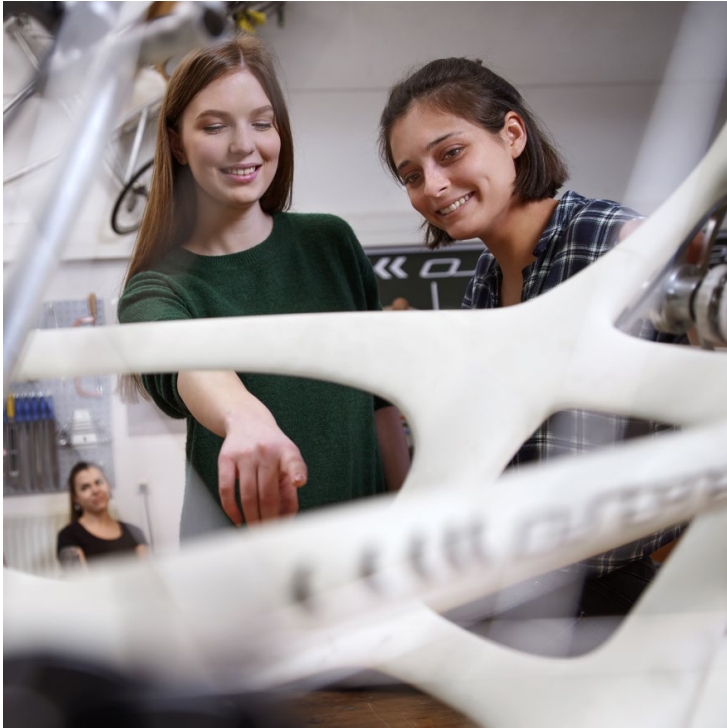
Abbildung 8: Willkommensmappe des Fachbereichs Technik