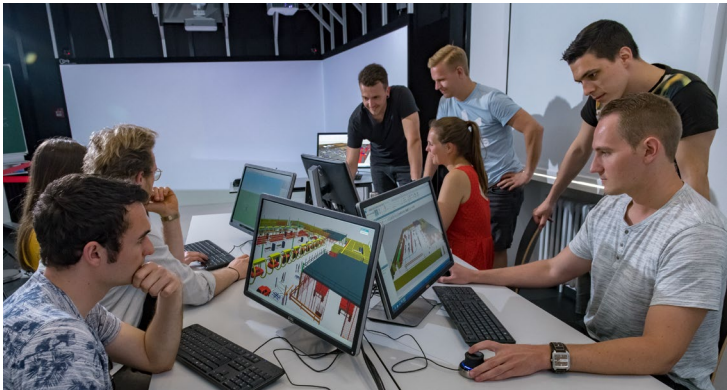
Abbildung 7: Willkommensmappe des Fachbereichs Seefahrt und Maritime Wissenschaften