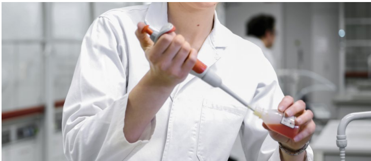
Abbildung 9: Willkommensmappe des Fachbereichs Technik