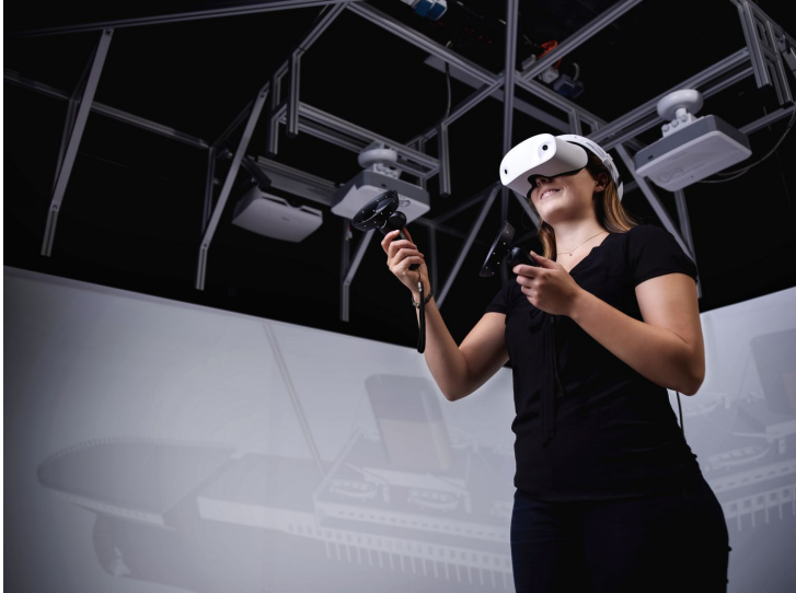
Abbildung 6: Willkommensmappe des Fachbereichs Seefahrt und Maritime Wissenschaften

Das zweite Bild zeigt eine Frau, die eine VR-Brille trägt und zwei Joysticks in den Händen hält. Sie bewegt sich offensichtlich in einer Simulationsumgebung und scheint in sich hineinzulächeln.