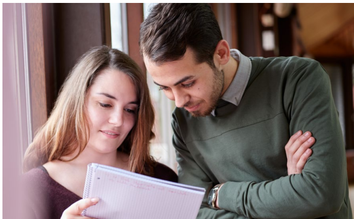
Abbildung 11: Willkommensmappe des Fachbereichs Wirtschaft

Der Fachbereich Wirtschaft stellt Kommunikationssituationen zwischen Studierenden in den Vordergrund seiner Selbstdarstellung. Das erste Bild zeigt einen Studenten und eine Studentin, die auf eine Kladde schauen, die die Frau in der Hand hält.