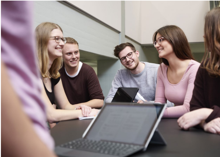
Abbildung 13: Willkommensmappe des Fachbereichs Wirtschaft

Die Bilder vermitteln eine große Selbstorganisation der Studierenden,