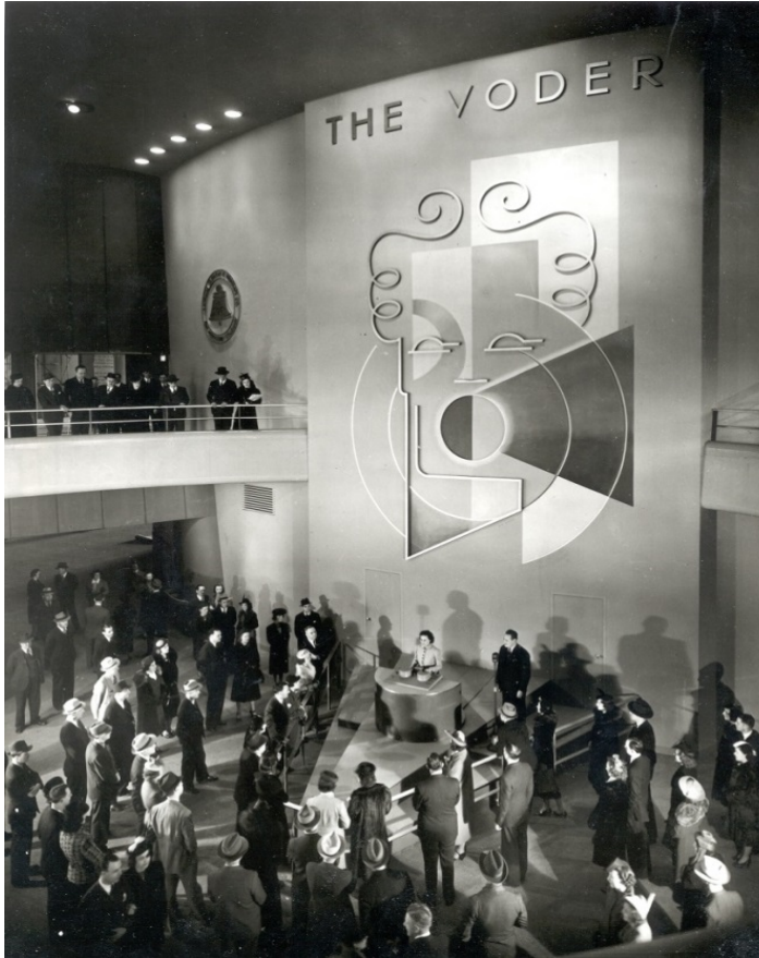
Abbildung 14: Vorführung der Sprachmaschine Voder auf der Weltausstellung in New York 1939.

Neben ihr steht ein Mann, er spricht in ein Mikrofon und erklärt offensichtlich den Vorgang. Darum herum steht das Publikum und lauscht der Vorführung.