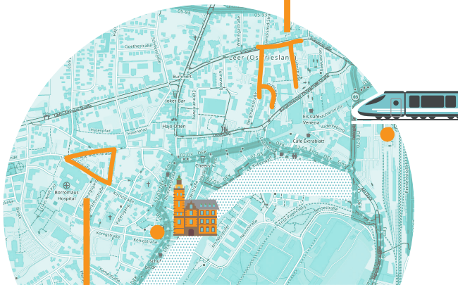
Angepasst: OpenStreetMap. Kacheln mit Genehmigung von Andy Allan